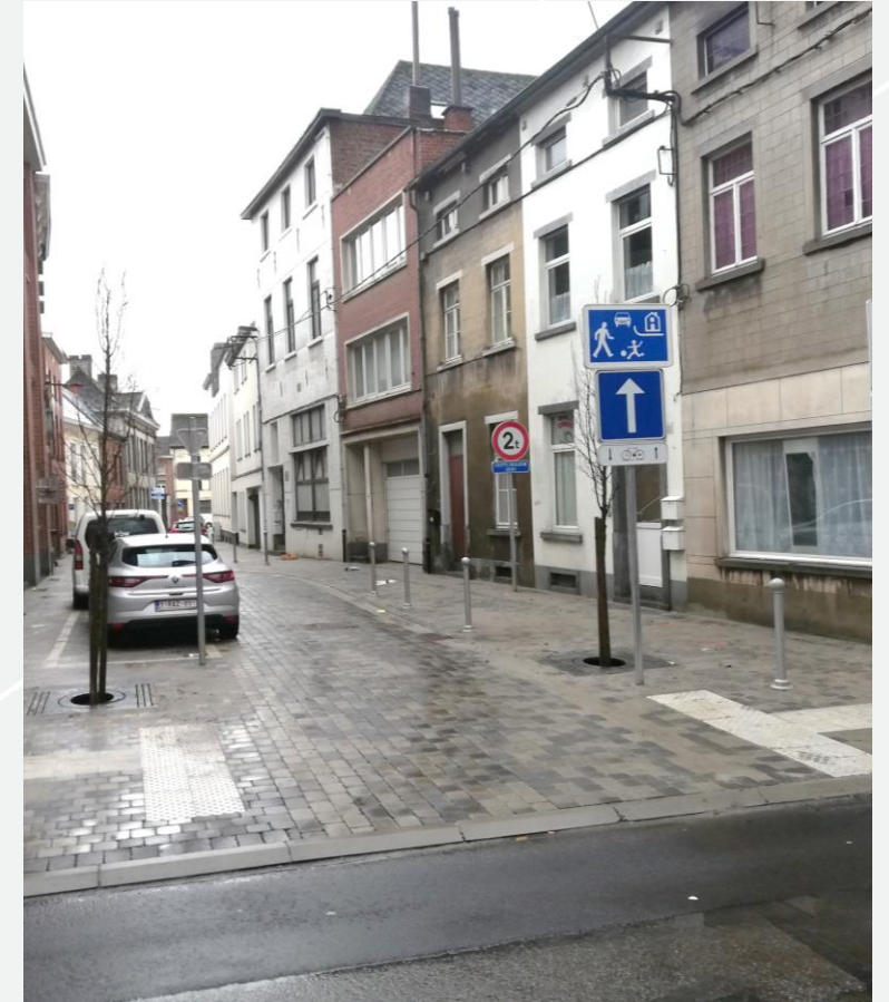
rue des Canonniers à Nivelles