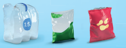
Films, sacs et sachets