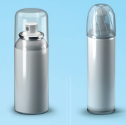
Aérosols alimentaires et cosmétiques