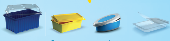
Barquettes et rapiers