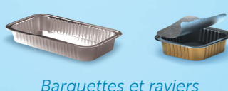
Barquettes et rapiers