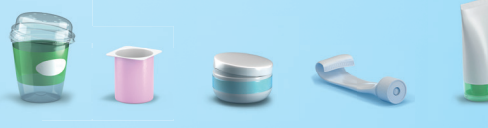
Pots et tubes