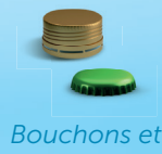
Bouchons et capsules